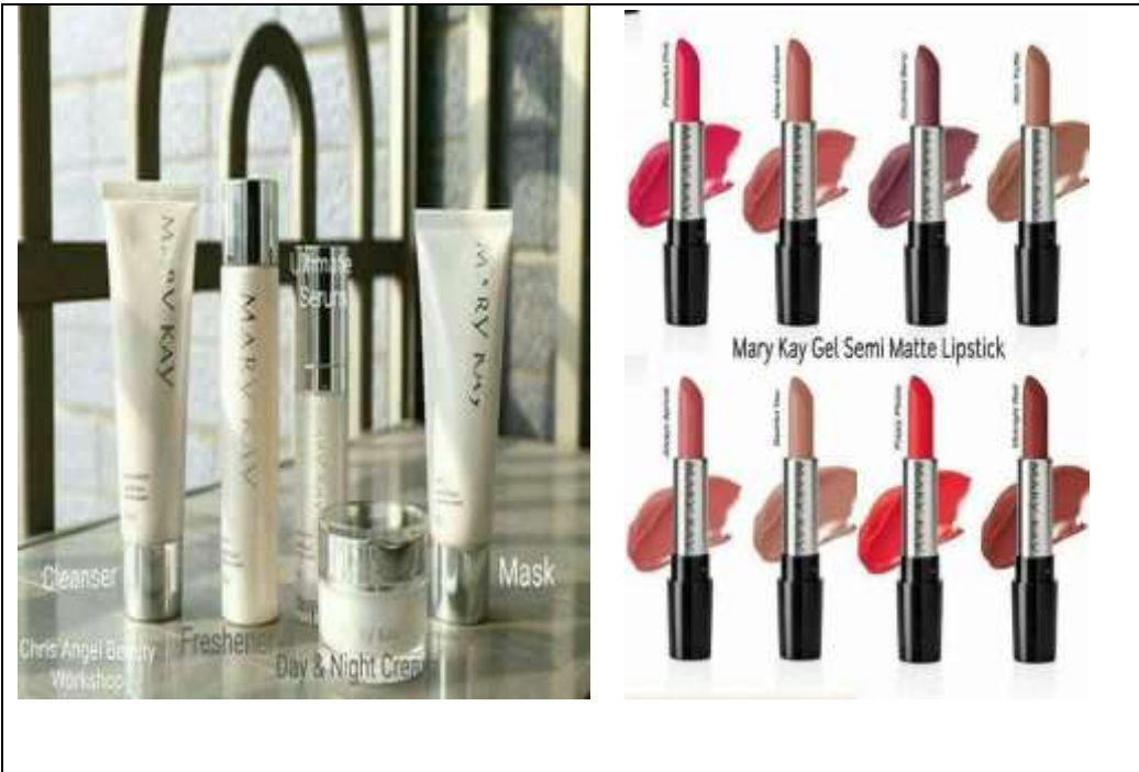
Caption : Antara produk yang dijual.