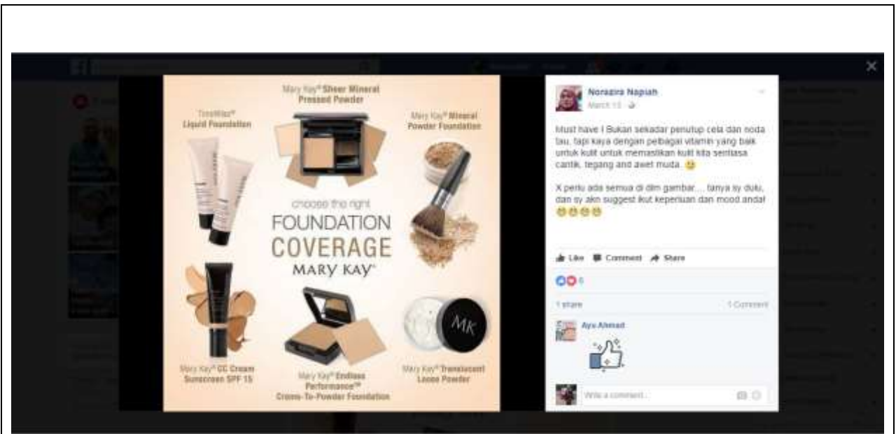
Caption : FB- Norazira Napiah